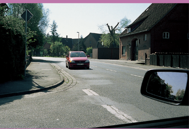
Aus Sicht von Fahrer B:

Er wollte nach links abbiegen und wartete auf eine Lücke. Als Fahrer A nach rechts blinkte, fuhr er los.