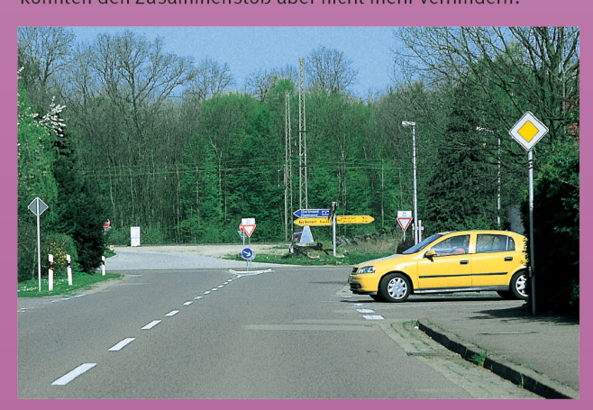
Aus Sicht von Fahrer A:

Lesen Sie sich durch, wie es zu dem Unfall kam und füllen Sie anschließend für beide den unten abgebildeten Ausschnitt aus einem Unfallbericht aus. Beide Fahrer haben noch gebremst, konnten den Zusammenstoß aber nicht mehr verhindern.