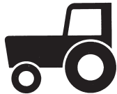
Kraftfahrzeuge und Züge, die nicht schneller als 25 km/h fahren können und dürfen