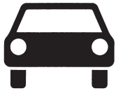
Kraftwagen und sonstige mehrspurige Kraftfahrzeuge